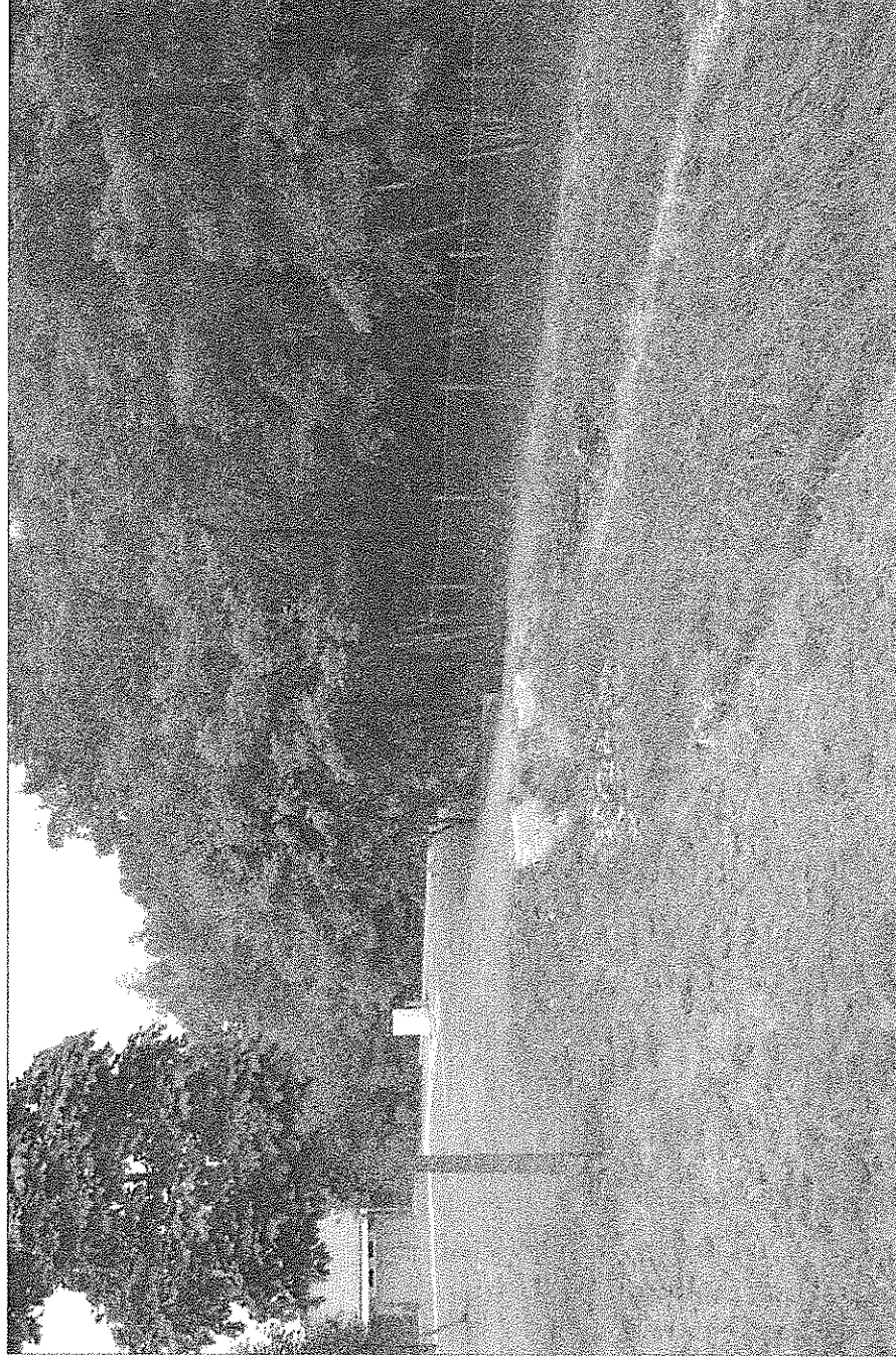
VV WAZV „Mittelgraben“ 30.11.2016