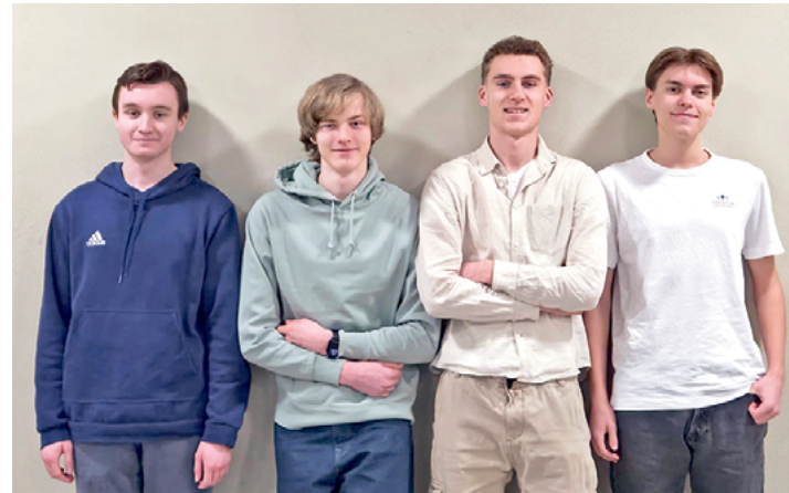
Das Projektteam vom Weinberg-Gymnasium Kleinmachnow. Ihr Seminarkurs-Projekt mussten die jungen Männer auch vor Lehrkräften und Mitschülerinnen und Mitschülern präsentieren.

Vier Abiturienten aus der 12. Klasse des Weinberg-Gymnasiums Kleinmachnow haben in den vergangenen Monaten die MWA sehr intensiv unter die Lupe genommen. Aus gutem Grund! Hier der Bericht des Projektteams.