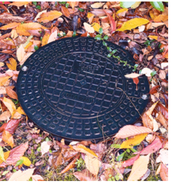
So ist es richtig. Der Übergabeschacht auf dem Grundstück muss unbedingt frei zugänglich sein. Deko und überwuchernde Pflanzen sind hier fehl am Platz.

Wie wäre es mit einem Freund oder Nachbarn, der während Ihrer